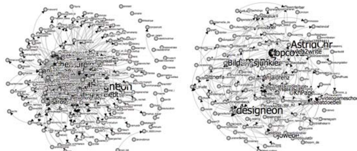
Abbildung 2: Dichte der Vernetzung im OPCO11 (links), OPCO12 (rechts)