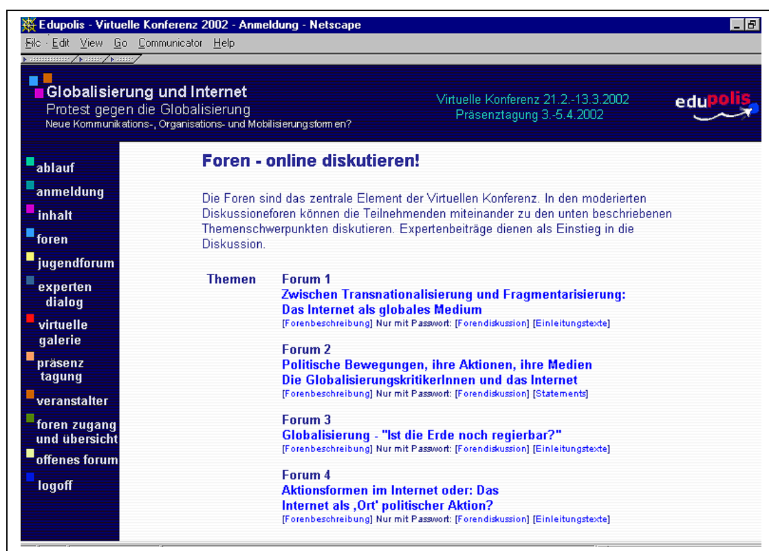
Abb. 4: edupolis Virtuelle Konferenz 2002 - Forenübersicht

Alle vier virtuellen Konferenzen entsprachen ihrer Struktur nach einer virtuellen Form traditioneller Tagungen mit mehreren parallelen Workshops, in denen Teilnehmende nach textbasierten Eingangsreferaten von Experten moderierte Diskussionen führen konnten. Im Unterschied zu realen Tagungen konnten die Teilnehmenden hier jedoch gleichzeitig an mehreren Foren teilnehmen. Während anfangs viele Teilnehmende genau dies vorhatten, erwies sich dies jedoch im Laufe der Veranstaltung häufig als zu hoher Aufwand und sie beschränkten sich auf die Teilnahme in einem, maximal zwei parallelen Foren, wobei sie in anderen Foren oftmals die Expertentexte oder einzelne Textbeiträge lasen. Die oben aufgeführten Veranstaltungen unterschieden sich jedoch hinsichtlich der Moderationsmethode, Anmeldung und Teilnahmegebühren. Gemeinsam war allen die Einleitung der Diskussion durch Expertentexte, die kurz vor Konferenzbeginn im Netz zur Verfügung gestellt wurden. Auch wurden in allen Konferenzen alle Verantwortliche, Betreuende, Moderatoren und Referenten den Teilnehmenden auf Webseiten vorgestellt, so dass die Teilnehmenden Ansprechpartner identifizieren konnten und Zusatzinformationen über die Referenten erhielten. Ab der 2001 durchgeführten Veranstaltung "Strategien für die Netzwerkgesellschaft" konnten die Teilnehmenden sich selbst ein Kurzprofil (Optional auch mit Foto) erstellen, mit dem sie sich den anderen Beteiligten vorstellen konnten, wodurch die Anonymität